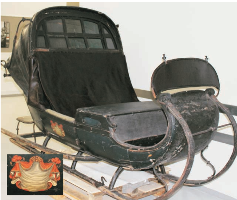
Kenraalikuvernööri Franz Seynin reki.

lehdet ja kirjat ladottiin ennen sekä valtavia määriä täytettyjä eläimiä jne. Meidän erityisen kiinnostuksen kohteena olivat reet, kiesit ja vaunut, joita oli todella paljon.