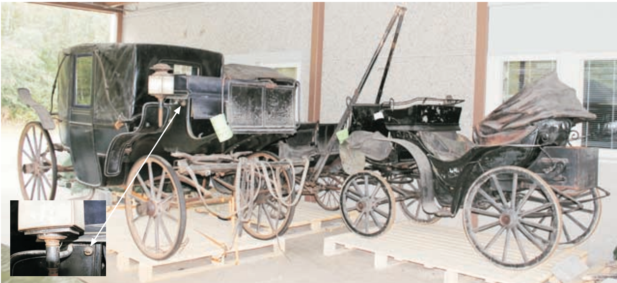
Erikoisuuksiin kuului mm. Jakovlevin vaunutehtaalla Pietarissa valmistunut sähköistetty Landau.